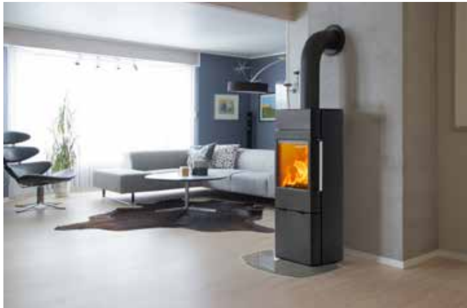
Scan 41-1 sin ventanas laterales

La Scan 41 tiene una maneta de apertura a lo largo de toda la puerta de la estufa para facilitar su operación desde cualquier altura.