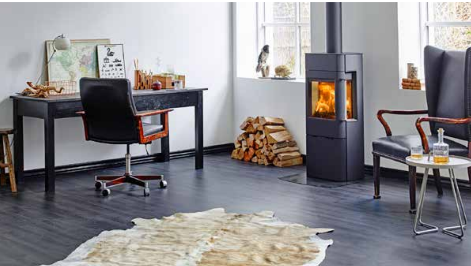
Scan 41-2 con ventanas laterales