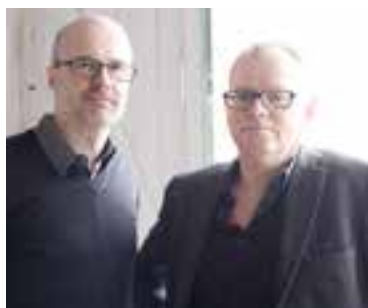
Designers: Harrit & Sørensen